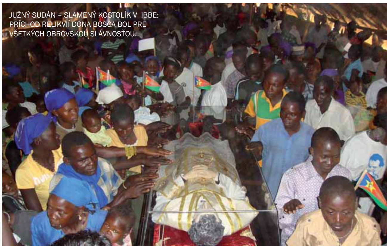
JUŽNÝ SUDÁN – SLAMENÝ KOSTOLÍK V IBBE: PRÍCHOD RELIKVIÍ DONA BOSCA BOL PRE VŠETKÝCH OBROVSKOU SLÁVNOSŤOU.