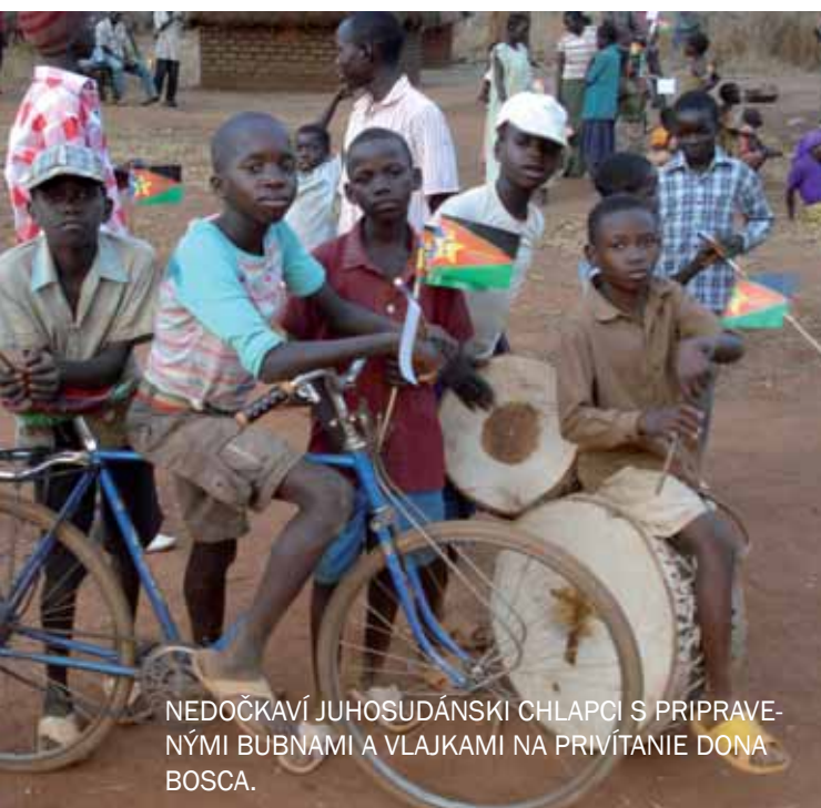
NEDOČKAVÍ JUHOSUDÁNSKI CHLAPCI S PRIPRAVENÝMI BUBNAMI A VLAJKAMI NA PRIVÍTANIE DONA BOSCA.

cov z ulice, ukrytá vo voskovej figuríne, znázorňujúcej tohto veľikána... Nikdy som sa s ničím podobným nestrela - mať relikvie nejakého svätca vo svojej blízkosti. Nevieť - možno to bolo únavou alebo príliš rozumovým vnímaním celej veci, ale prvé stretnutie s relikviami dona Bosca som vôbec duchovne neprecitila... Asi tak po týždni prišlo na rad aj naše centrum v Kala-Kala. Návšteva dona Bosca bola starostlivo naplánovaná - kedy príde urna, kto